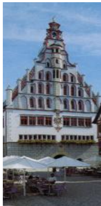
Rathaus Bad Waldsee

Der reizvolle Mischwald, der einen sehr langen, aber schmalen Höhenzug bedeckt, ist bald durchschritten. Es ist die Randmoräne einer Seitenzunge des Rheingletschers aus der Würmeiszeit. Am jenseitigen Waldrand stehen wir etwas oberhalb des breiten Tales des kleinen Haisterbaches. Dieses Tal wurde nicht durch das Bächlein, sondern von den mehrere hundert Meter dicken Gletschern ausgehobelt.