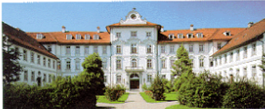
Schloss und Kloster Bad Wurzach

Endpunkt und zugleich künstlerischer Höhepunkt unserer Wanderung ist das ehemals Waldburgische Schloss mit seinem prächtigen Barock-Treppenhaus und schönem Deckenfresco. 1924 richteten die Salvatorianer im Schloss ein Kolleg ein, das bis heute besteht.